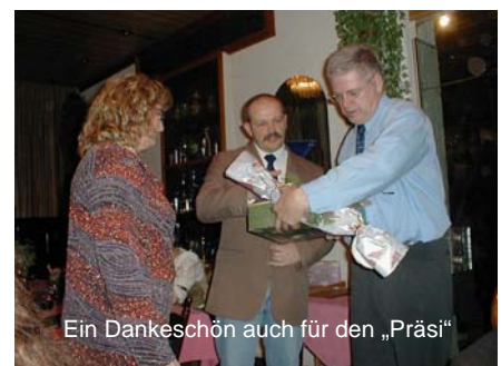
Ein Dankeschön auch für den „Präsi“

Ein kurzer Ausblick ins Jahr 2005 vervollständigte den schönen Abend.